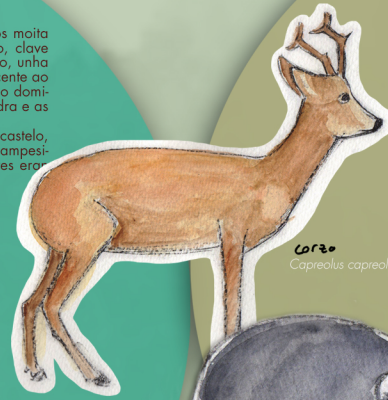
corzo Capreolus capreolus

O monte de Laxoso mantén un convenio coa administración forestal, que foi a que plantou nos anos 90 a masa de piñeiro que atravesamos. A xestión pouco intensiva favoreceu o crecemento dun sotobosque variado e rico en especies autóctonas. Podemos apreciar tamén mouteiras dunha especie de eucalipto menos estendida en Galicia que se caracteriza pola súa casca grosa e fibrosa algo rosada, unha copa ben frondosa con follas máis anchas, e portos as veces maxestosos.