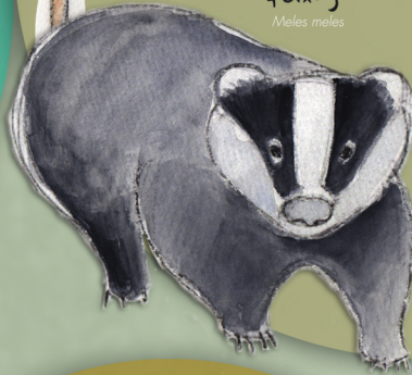
teixugo Meles meles