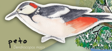
peto Dendrocopos major