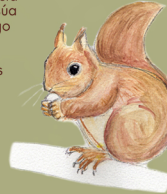
esquío Sciurus pusillus