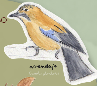
arrendajo Corvus glandarius