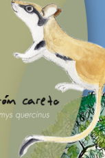
leirón careto Elomys quercinus